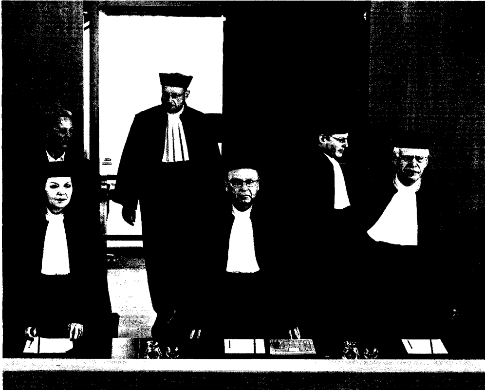
Karlsruher Verfassungsrichter: Antworten auf brisante Fragen

auch Geld in Maßanzüge und Pelze investiert. Sie schlugen vor, bei Kultur und Freizeit zu kürzen, weil sich Menschen mit niedrigem Einkommen laut Stichprobe ab und an auch Sportflugzeuge und Boote leisteten. Am Ende stand – völlig überraschend – der Wert, den die Bundesregierung vorgeschlagen hatte: 345 Euro.